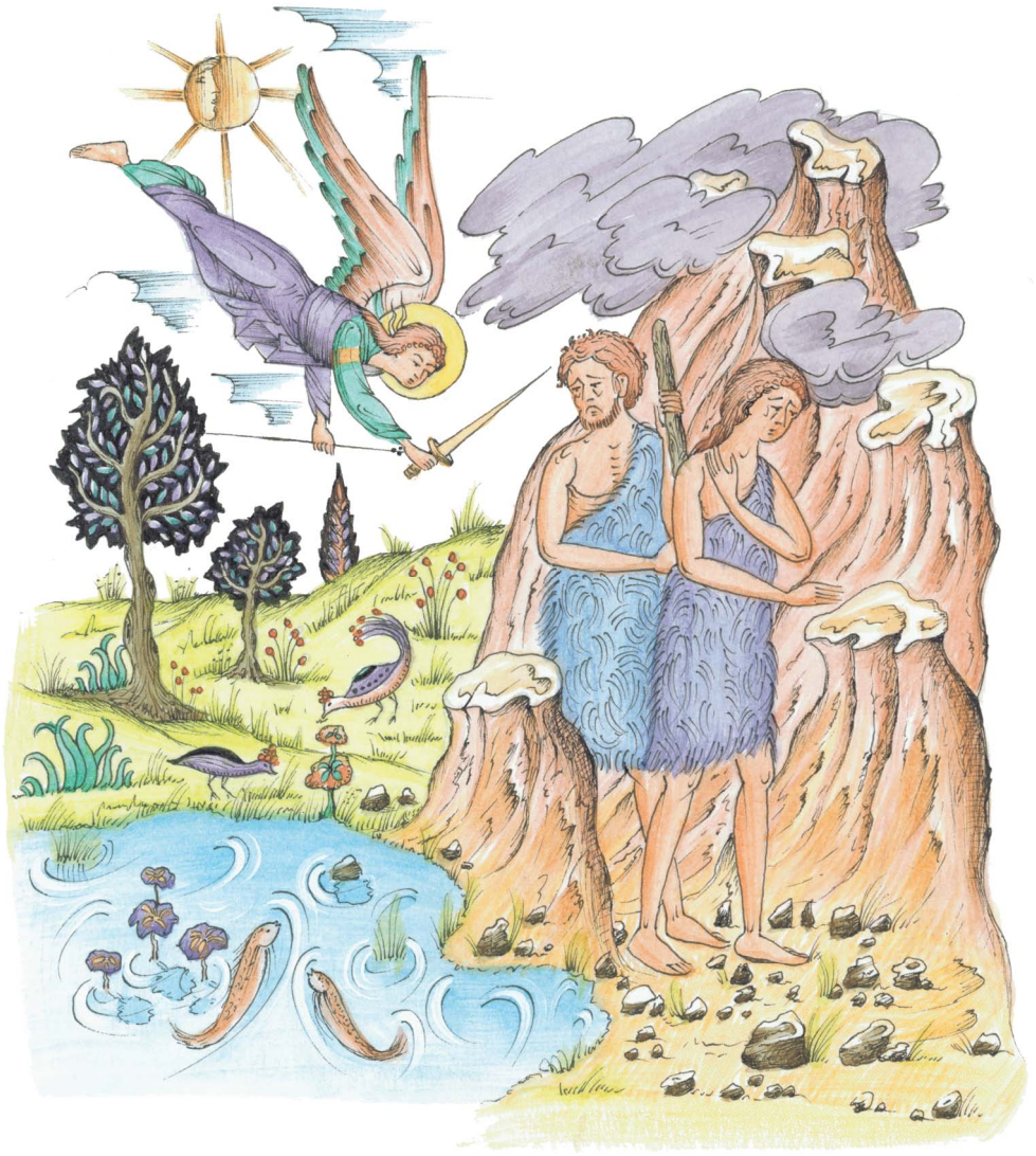
6. Sie verließen das Paradies