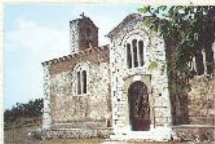
Ο ίδιος Ναός δίπλα στην καταδυναστεύει εμπειρία