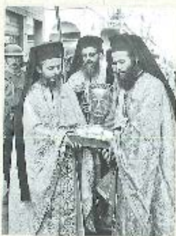
Απονομή Κόρωνας (αγ. Ανδρέου Πόρτας) με, από αριστερά κ. Μητροπολίτης Ξάνθης (αριστερά)