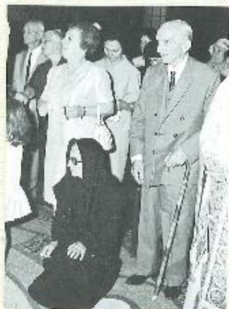
Ο πατέρας και η μητέρα του καταπαύσαντα κατά την χειρουργική επέμβαση