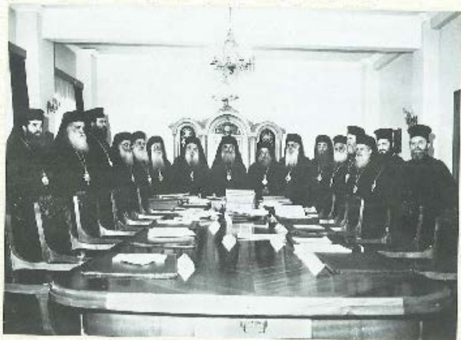
Μέλος της Διεκπαιδευτικής Επιτροπής