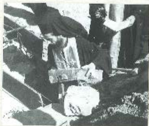
Τυποθέτηση της νέου λόγου από Νουί