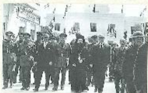
Στό Μαρτύριον της Λαοδικείας, από Έθνη της Ρωσίας