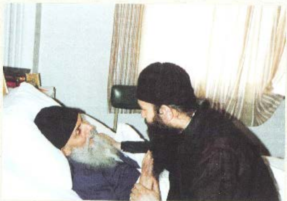
Στη Προσκυφή Κληρικῶν Ἑλλάδος ἄρτι μισοῦ, 1945, πρὸ κοινοῦ τοῦ