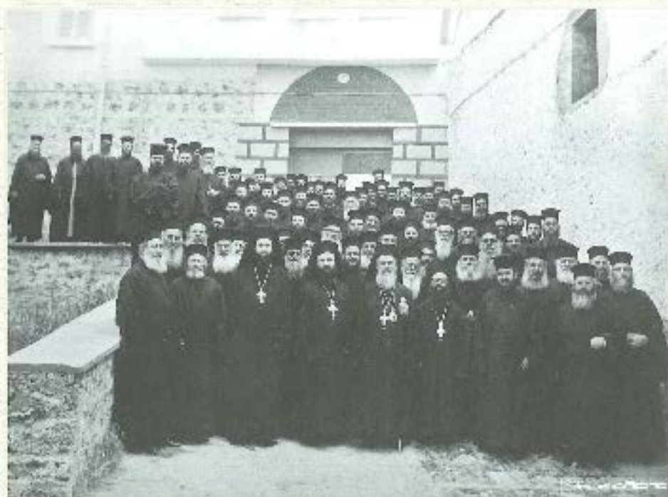
Γερμανικό Σάββατο (1970)