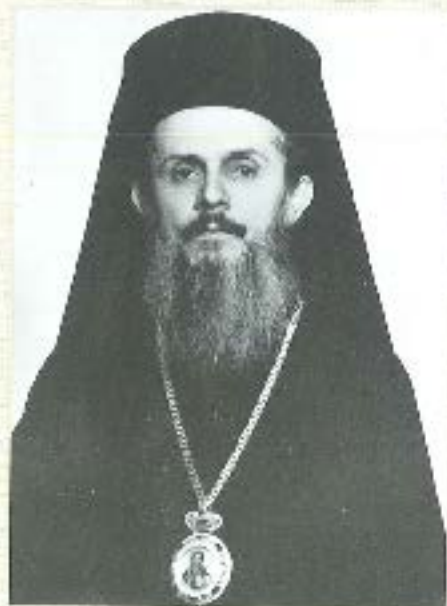
Φωτογραφία του πατέρος