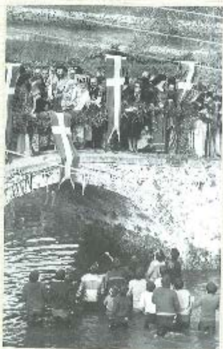
Βασίλειο της Έβρου