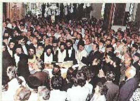
Από την Εξόδιον Βασιλικήν του *