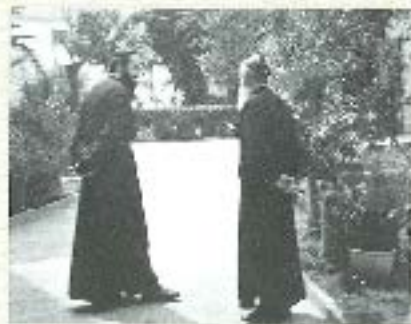
Στόν κήπο της Ήρας Αγκυροπούλης