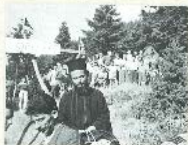
«Στις Κατασκευαστικές του αγ. Βλαδίου (Γέννηση από ίδιον)