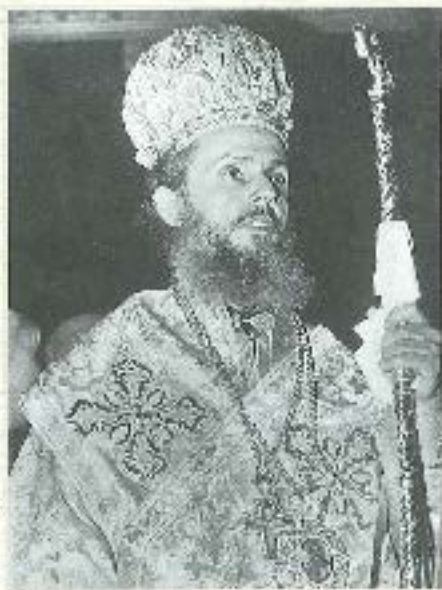
Κατά την χειροτονία του