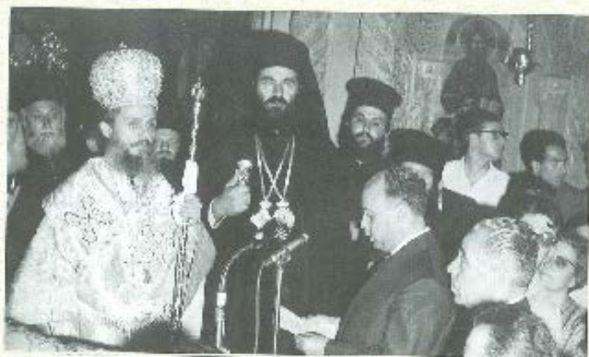
Πρεσβυτήριον Μασσαλάρου κατά την Χειροτονία του.