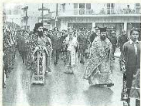
Για την εορταστική επίσκεψη του Πάτριου Συναξαρίου στην Κόμοσο (στην Κόμοσο)