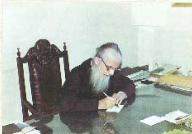
Στη Γραφείο του στην Τεράκη Χερσόνησος - Πάριος

Αποφ. 50.000 (Ποσότητα κ. ποσότη) της Θεολογικής Σχολής της Θεολογικής Σχολής της Θεολογικής Σχολής της Θεολογικής. Εξοφ. ποσότητα της Σχολής της Θεολογικής Σχολής της Θεολογικής Σχολής της Θεολογικής Σχολής της Θεολογικής Σχολής της Θεολογικής