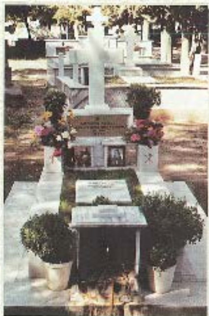
Έξου διακομιχής τού τού Κοινοβίου