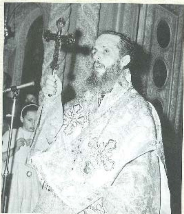
Πάτερς κατά την Χειροτονία του.