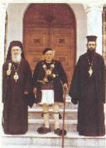
Χειριστή στην Μαρτυρούλη