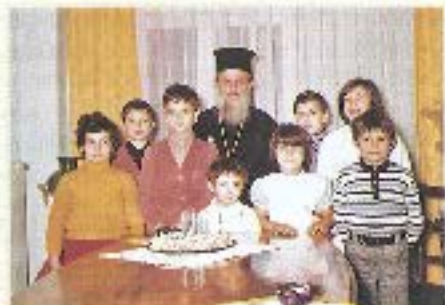
Με το παλιό και άσηματο ποσό και την άγα- πη τους