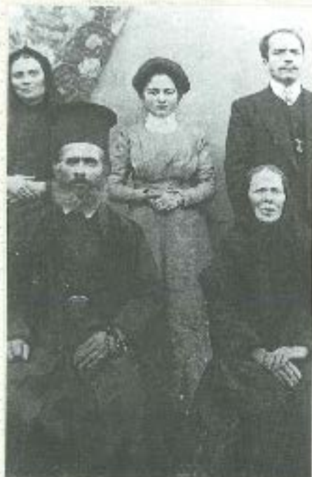
Ο πατέρας, ο γιος και η μητέρα του (στο μέσο)