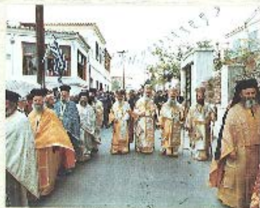
Στ. Λειτουργία τοῦ στ. Νικητορίου στὴν Ἀθήνα (ὅσοι πρὶν τὴν ἐπιτέφαισιν τοῦ, πρῶτος ἀπὸ δεξιά)