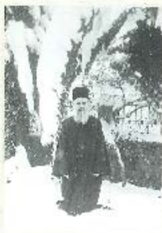
Στη χειμερινή προερίκη του Μητροπολίτου Ουρουσίου Ουδέστου Τζάνου