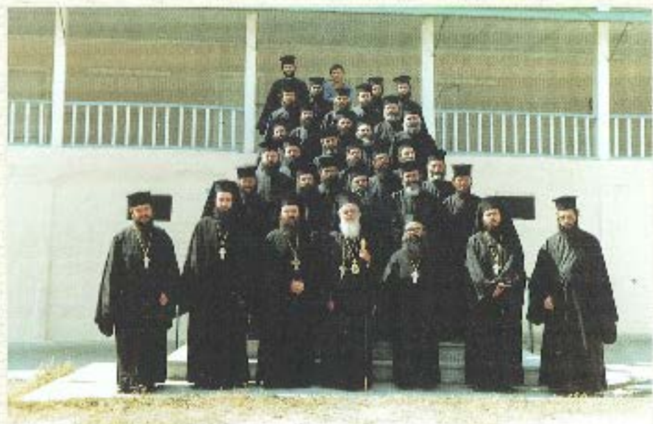
Γερμανικό Σάββατο στην Γαλή Μονή Αγίου Τριόδου Έδεσσας