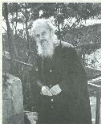
Νεώτερος από Μητροπολίτη Θεσσαλονίκης