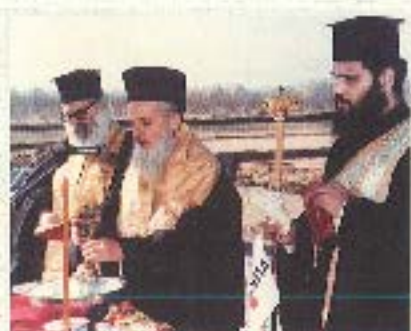
Άγιοςμός από Ν.Σ. Έδεσσας