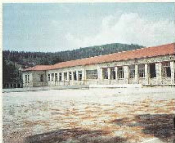
Τό Πνευματικό Θέατρο σήμερα