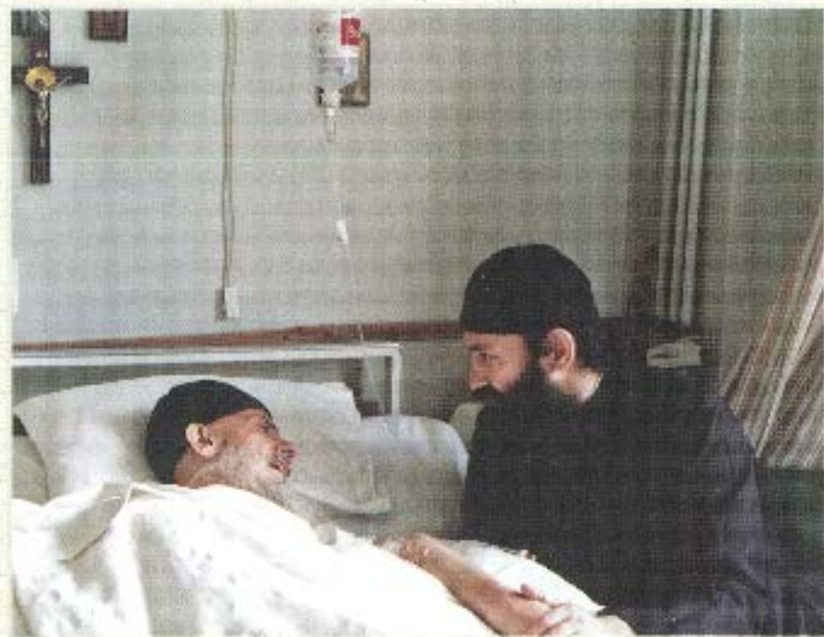
Xobeni epi Ntanoj paja