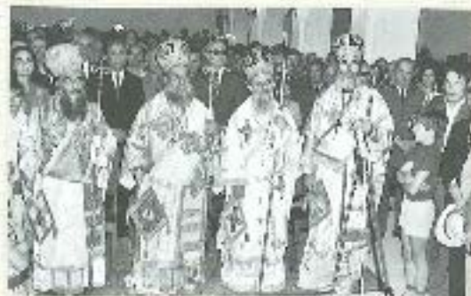
Στη λειτουργία του Ιερού Νεοῦ στ. Κοσμά τοῦ Ἀθηναίου Κορίνθου, ἑκατομῆρα, ἀπὸ δεξιά