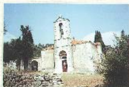
Το καλντερίκι της Θεοτόκου Μουρβιόλαβου. Δίπλα ζαχαρεύεται ο γάλακτος του