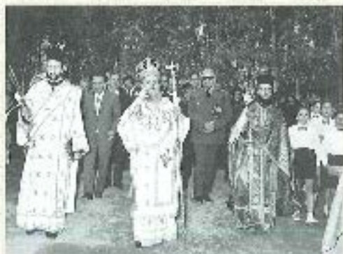
Αποστολή στην Κρήνη Αρκαδίας (1871)