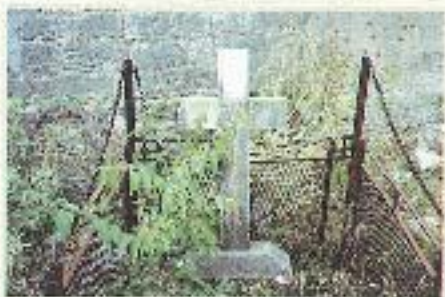
Το μέρος του κτισμού του Αθανασίου Καρβιού