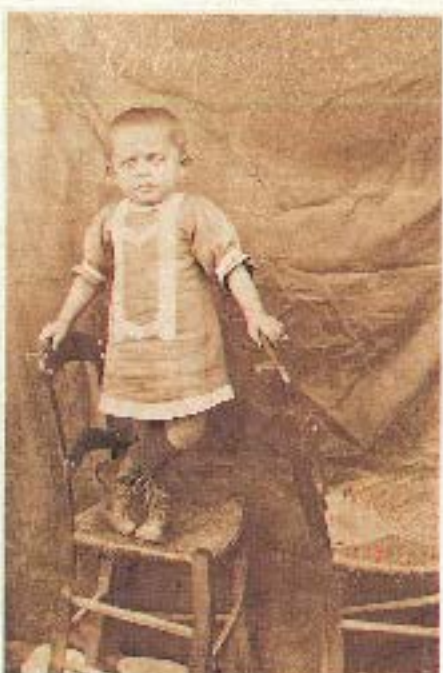
Σε ηλικία πέντε ετών (1922)