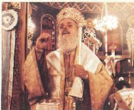
Προερίκη από καθ' ύλην αρμοδίαν κατά την Διόκημο Χιουροπούλης