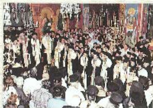
✦ Γενεθλιός ενός Κοινοβίου