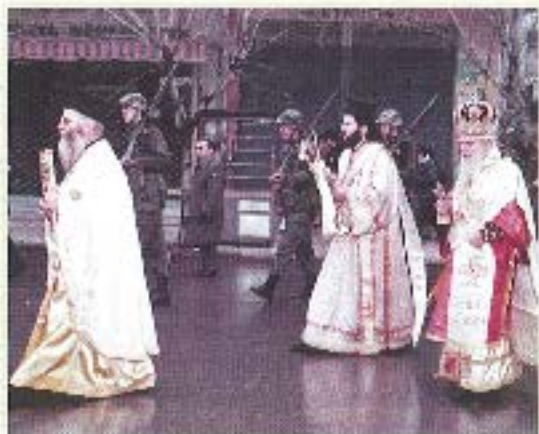
Ταξινόμηση Επισκόπων στην Έδεσσα. Μετά από το Κωνσταντινούπολη