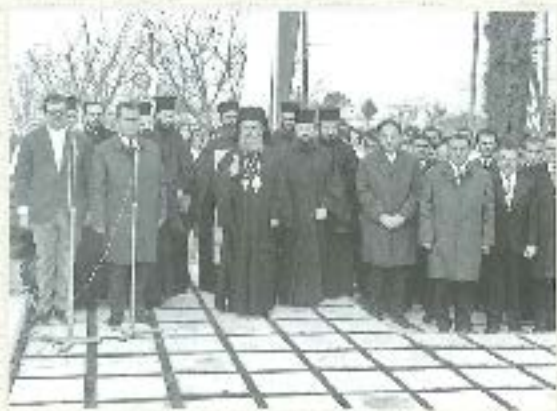
Ύψωση από Πρωτοσύνοδο