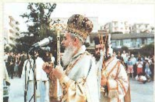
Είχε ένα μυστικό το Μυστήριο της Βασιλείας