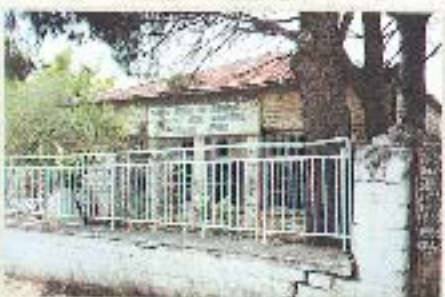
Το Γυμνάσιο Θέρσου