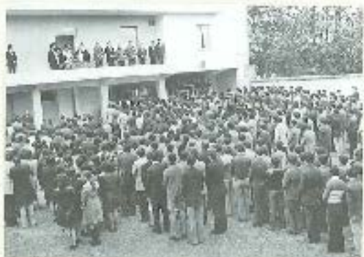
Ἀγριαῖος τοῦ Ἱεροῦ Νεοῦ Ἐβραίου