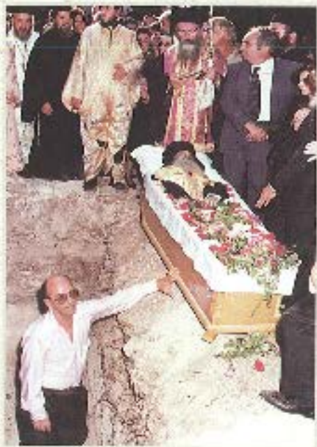
Λόγω τής τής Διακομιχής