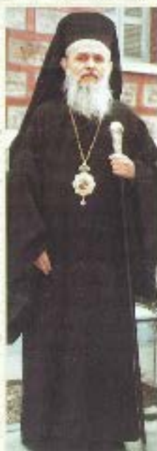
Μοναχός από Μεγαροχώριό Μέγαρο