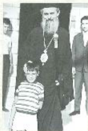
Στην Κωνσταντινούπολη της Μ. Μαρτυρούλης στη Πόλη